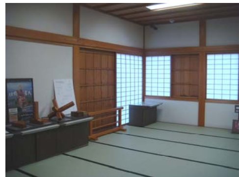
ヒント：【パズルコーナー】