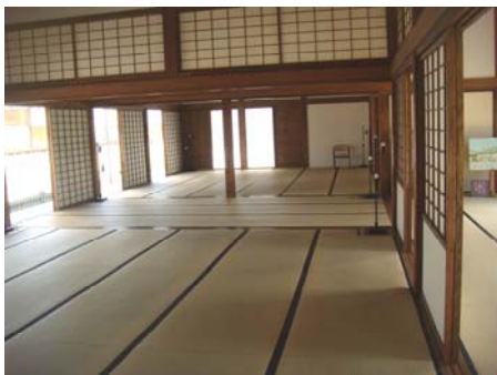
ヒント：【御座間・堪忍所】